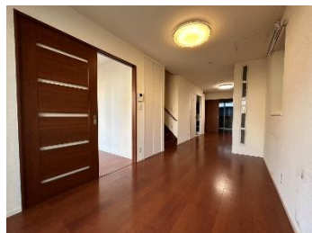
概略図に付、現況を優先します。