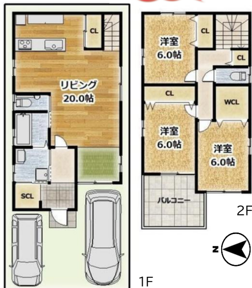
概略図に付、現況を優先します。